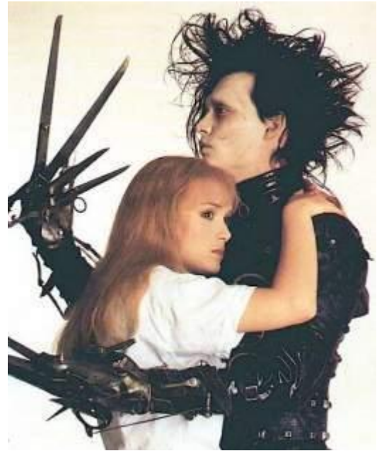
Arriba: Imagen de merchandising de la película "Eduardo manostijeras"

En 1982 Hansel y Gretel se convierte en el último cortometraje que dirigió, aunque participó como animador en otro en 1984, gracias al éxito de sus cortos logró el encargo de su primer largometraje La gran aventura de Pee-Wee en 1985 por Warner Bros, logrando la película más taquillera del año 1988 con su segundo largometraje Beetlejuice . En ese intervalo de 3 años colaboró con Disney como animador y en televisión, lo que le dio más credibilidad para que otros productores confiaran en él. Además, suponemos que se dieron cuenta de que el imaginario de Burton concordaba perfectamente con el espíritu de los 80 y principios de los 90, convirtiéndose en un director icónico en Occidente: la juventud de esos años, sin conocer guerras, vivían dentro de una espiral de consumismo que había comenzado hacía relativamente poco, con un sentimiento de insatisfacción y desilusión completamente acorde con los personajes e historias de Burton. Tampoco podemos obviar el postmodernismo incrustado en las capas intelectuales de la sociedad de entonces, que llegaban a hacer apología de las drogas apoyando a la epidemia extendida entonces: ese ambiente oscuro y decadente de drogadicción puede verse reflejado en el universo Burtoniano.