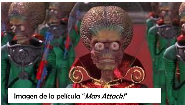
Imagen de la película "Mars Attacks!"

Finalmente, en 1989 se estrenó la película que le llevaría al estrellato: Batman . Burton cambió para siempre la forma de representar a este personaje, de forma muy alejada del cómic original y dirigida a un público principalmente adulto... ¿Vimos aquí el principio de lo que hoy en día es normal, los adultos entregados a historias fantásticas y antaño consideradas infantiles?