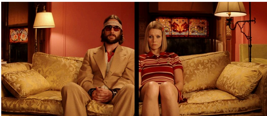
Moonrise Kingdom (2012), Fantastic Mr.Fox (2009), The Royal Tenenbaums (2001)