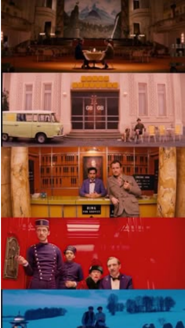
El Gran Hotel Budapest (2014)