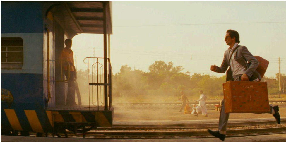
Viaje a Darjeeling (2007)

Gran uso de la simetría con líneas marcadas en el espacio, y meticulosidad y orden. Hace una minuciosa elección de los objetos en escena y sus escenarios están perfectamente organizados, transmitiendo la idea de mundos casi perfectos estéticamente.