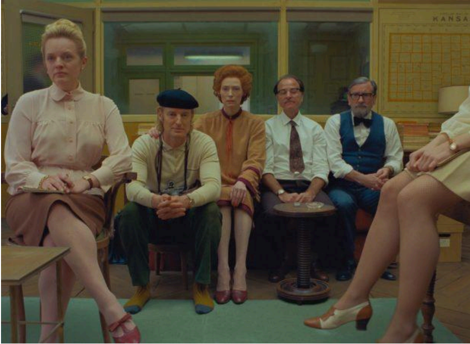
Life Aquatic (2005), La Crónica Francesa (2021)